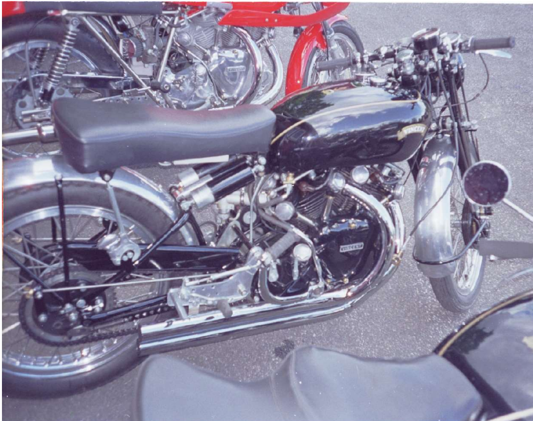
En Rapide som är mantalsskriven i Rödeby i Blekinge