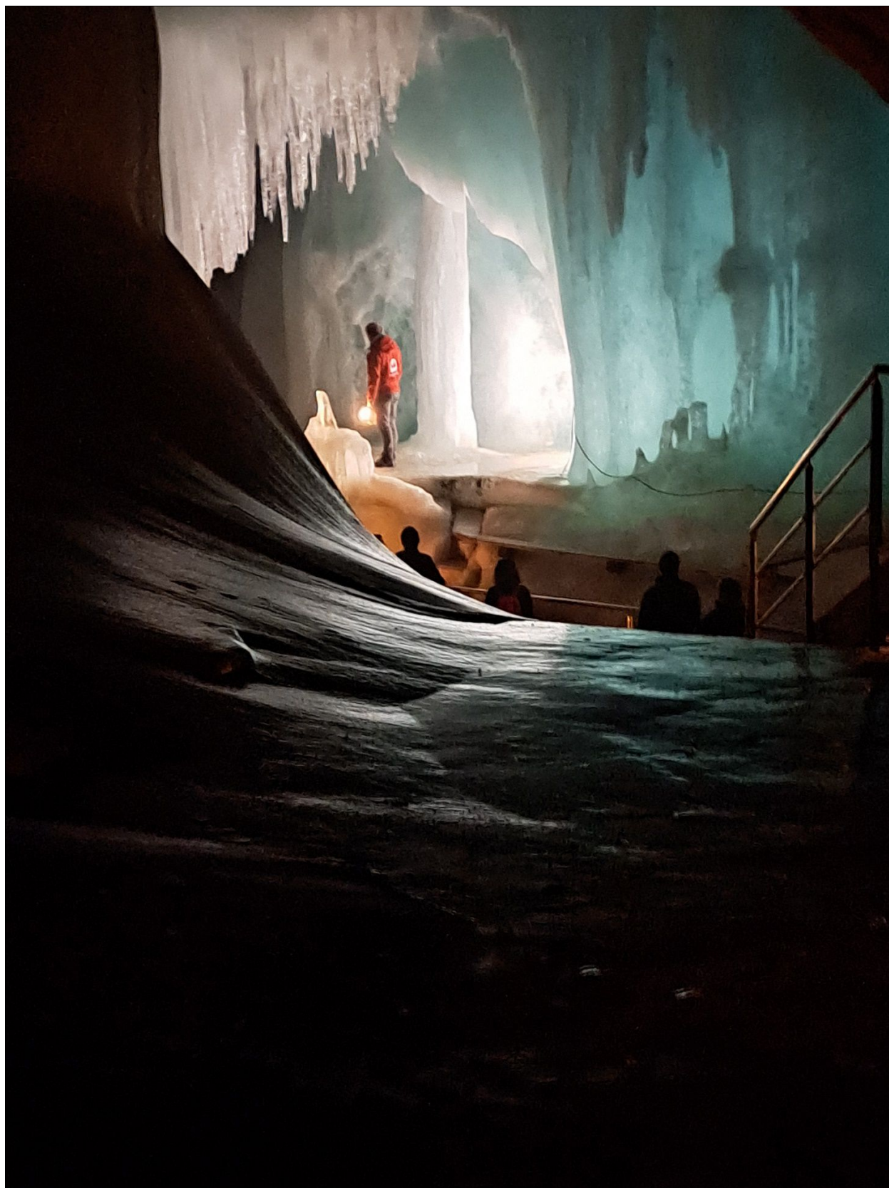
Isgrottor i Österrike som träffdeltagarna fick besöka. Guiden använde inte lampa utan skapade ett intensivt ljus med en rulle brinnande magnesiumtråd.