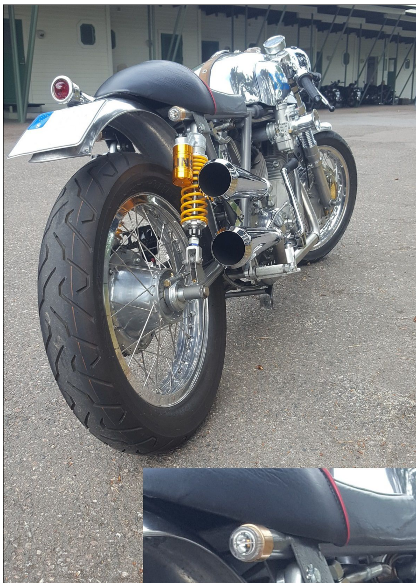
Fiffigt infälld blinkers i ramröret.